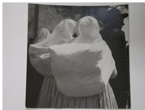
FOTO: Jan Lauschmann, Venkovanky, 1934

Jan Lauschmann (1. dubna 1901 Roudnice nad Labem – 1. ledna 1991 Brno) se jako chemik pohyboval mezi zájmovými i profesionálními fotografy. Vědecky se zabýval technologií fotomateriálů a působil jako vysokoškolský pedagog. Dominantou jeho tvorby bylo krajinářství a efektní detaily z prostředí měst či venkova. Často publikoval a obesílal salony. Tvůrčí zápasy vedl pod praporem D. J. Růžičky, s jehož neteří se oženil. Nového uznání se Lauschmannovi dostalo po retrospektivě při veletrhu Interkamera 1971.